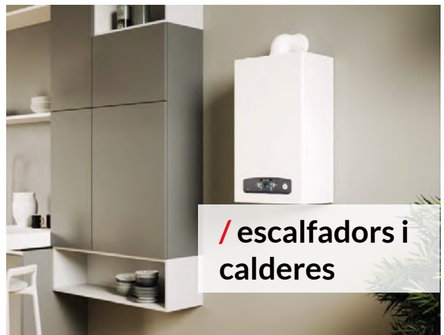
/ escalfadors i calderes