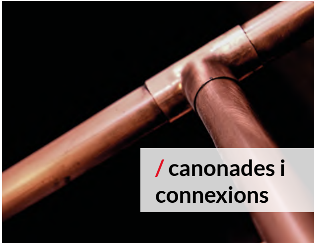
/ canonades i connexions