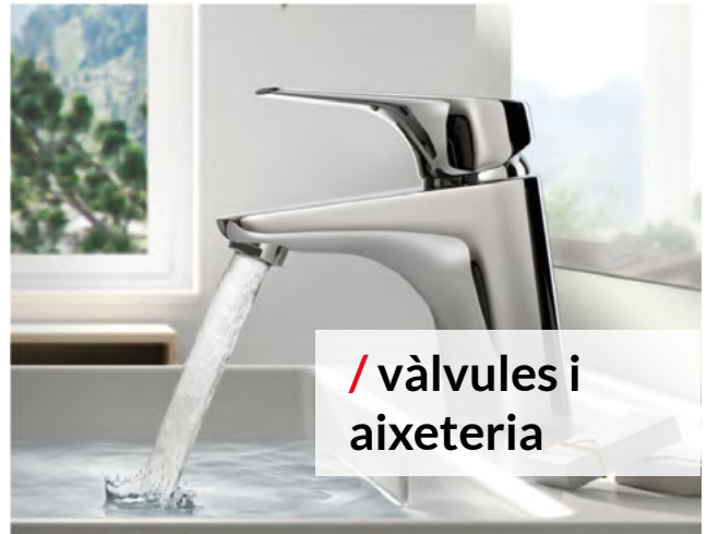
/ vàlvules i aixeteria