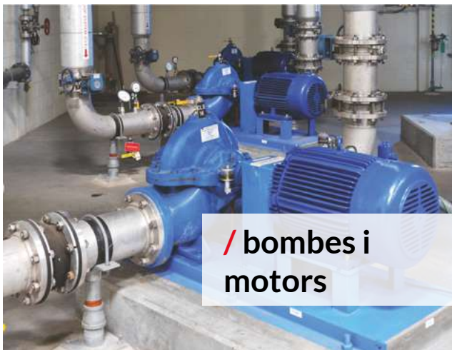
/ bombes i motors