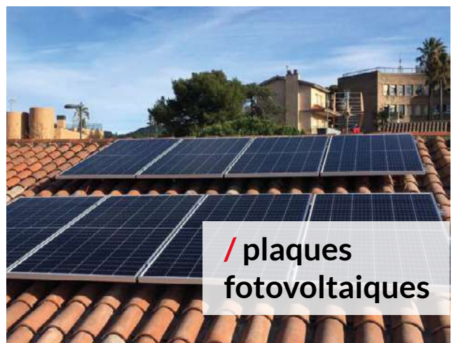
/ plaques fotovoltaiques