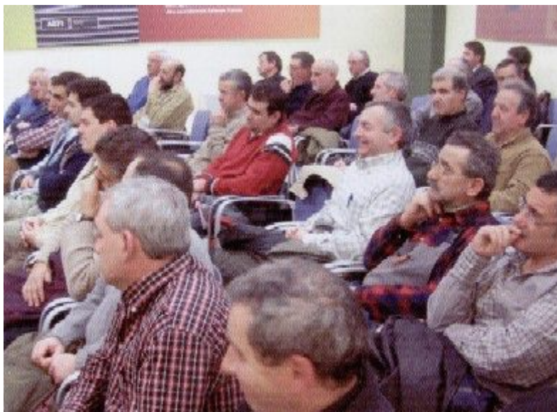
A la reunió es van tractar els temes que importen als instal·ladors.

A proposta d'alguns assistents, es va fer una votació per veure el grau d'acord amb les obres i amb la gestió de la Junta Directiva, amb un resultat del 93% de vots a favor.