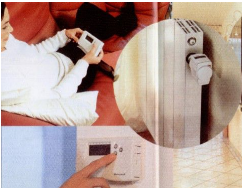
Una dona regula la temperatura d'una habitació amb el comandament a distància.