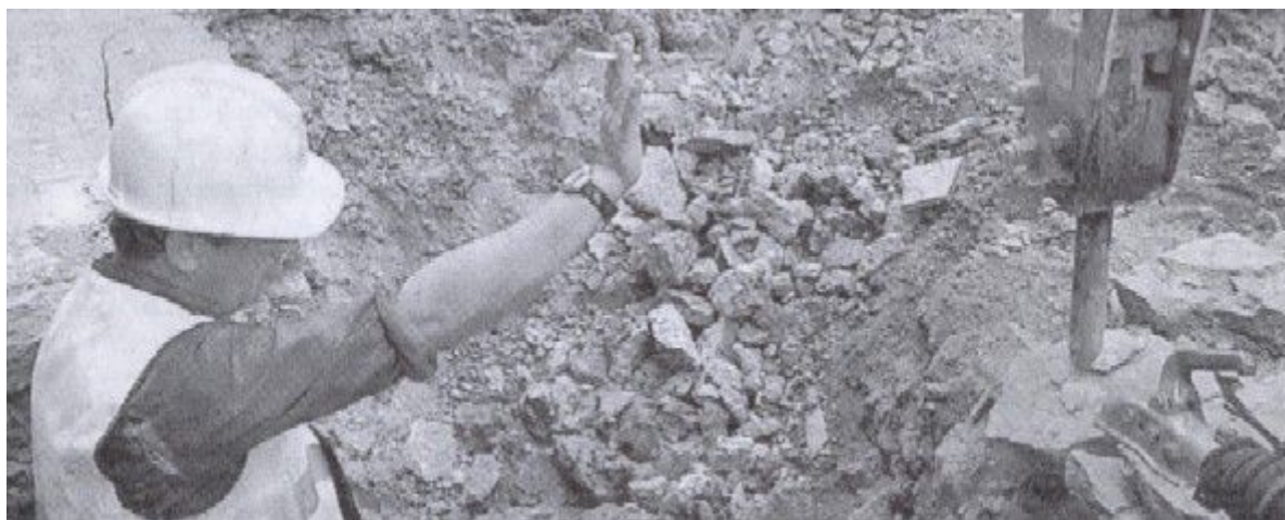
Els treballadors poden tenir problemes per culpa del soroll, segons l'OMS.