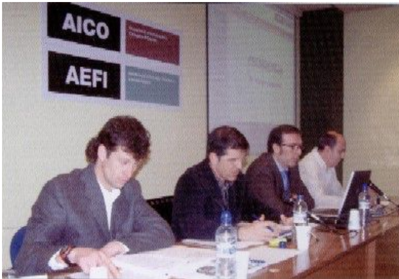
Des de la taula van facilitar tota la informació.

Text modificat art. 1r: D'acord amb el que estableix la Llei 19/77 d'1 d'abril, en la que es regula el dret d'Associació Sindical, es constitueix l'ASSOCIACIÓ D'INSTAL·LADORS D'AIGUA, ELECTRICITAT, GAS I CLIMATITZACIÓ DE LA COMARCA D'OSONA I ADJACENTS , que podrà utilitzar, com a distintiu de manera abreujada, les sigles A.I.C.O.