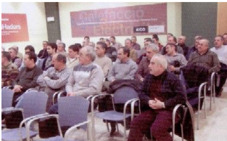
Vista parcial de la sala d'actes en el decurs de la reunió.

Aquests preus són sense IVA. La facturació mínima s'estableix en una hora.