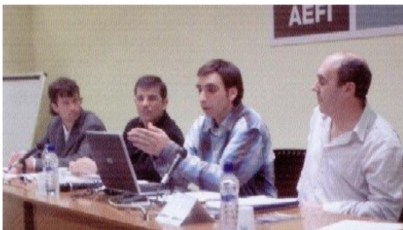
La reunió va cloure amb l'assemblea d'AEFI.

Com a punt i final de les dues assemblees als presents s'els va projectar el DVD d'AICO que durant l'any 2005 es va actualitzar.