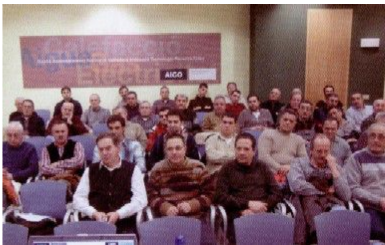
Els socis van seguir la reunió amb molt d'interès.