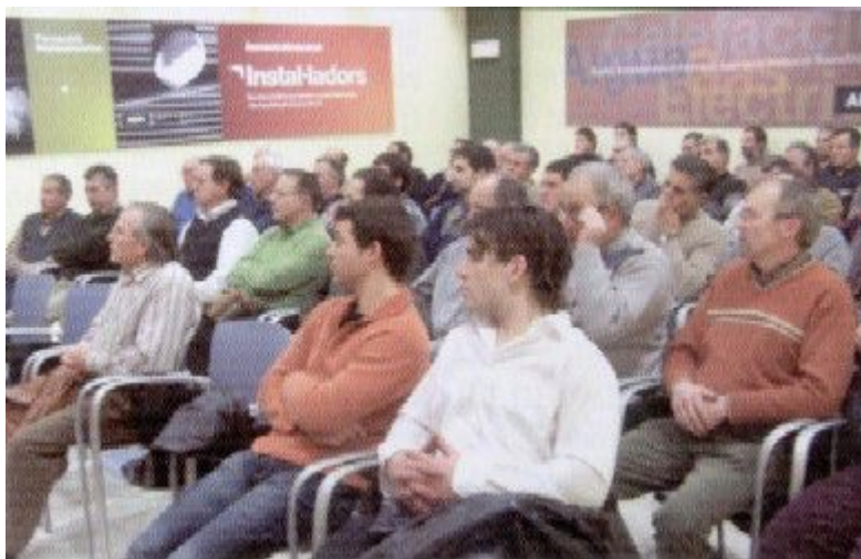
Els socis van rebre informació detallada de la feina de les comissions.