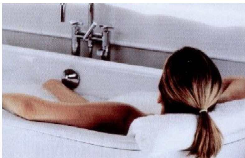
Les instal·lacions d'aigua sanitària poden estar associades a la legionel·losi.

Des del seu reservori natural, el bacteri pot colonitzar els sistemes d'aigua calenta i freda dels edificis o altres sistemes que necessitin aigua per funcionar. Si la instal·lació disposa d'algun sistema que produeixi aerosols, les gotes d'aigua que contenen el bacteri poden ser inhalades i provocar la legionel·losi en grups específics de risc.