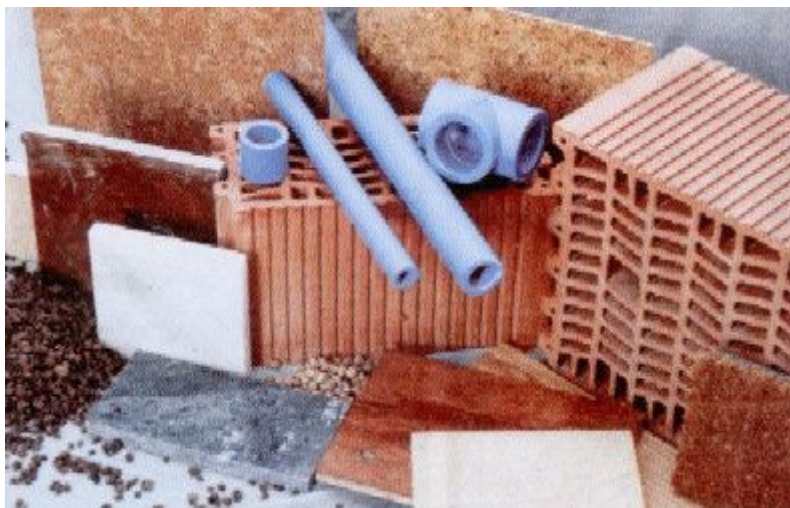
Els nous models primen els materials ecològics.

Fins fa poc el PVC era gairebé l'única alternativa per a desaigues i canonades, avui s'utilitza el polipropilè que és un material menys contaminant i difícilment inflamable.