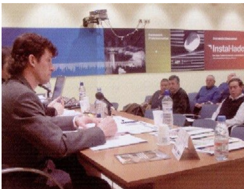
Un detall de la sala des de la presidència.